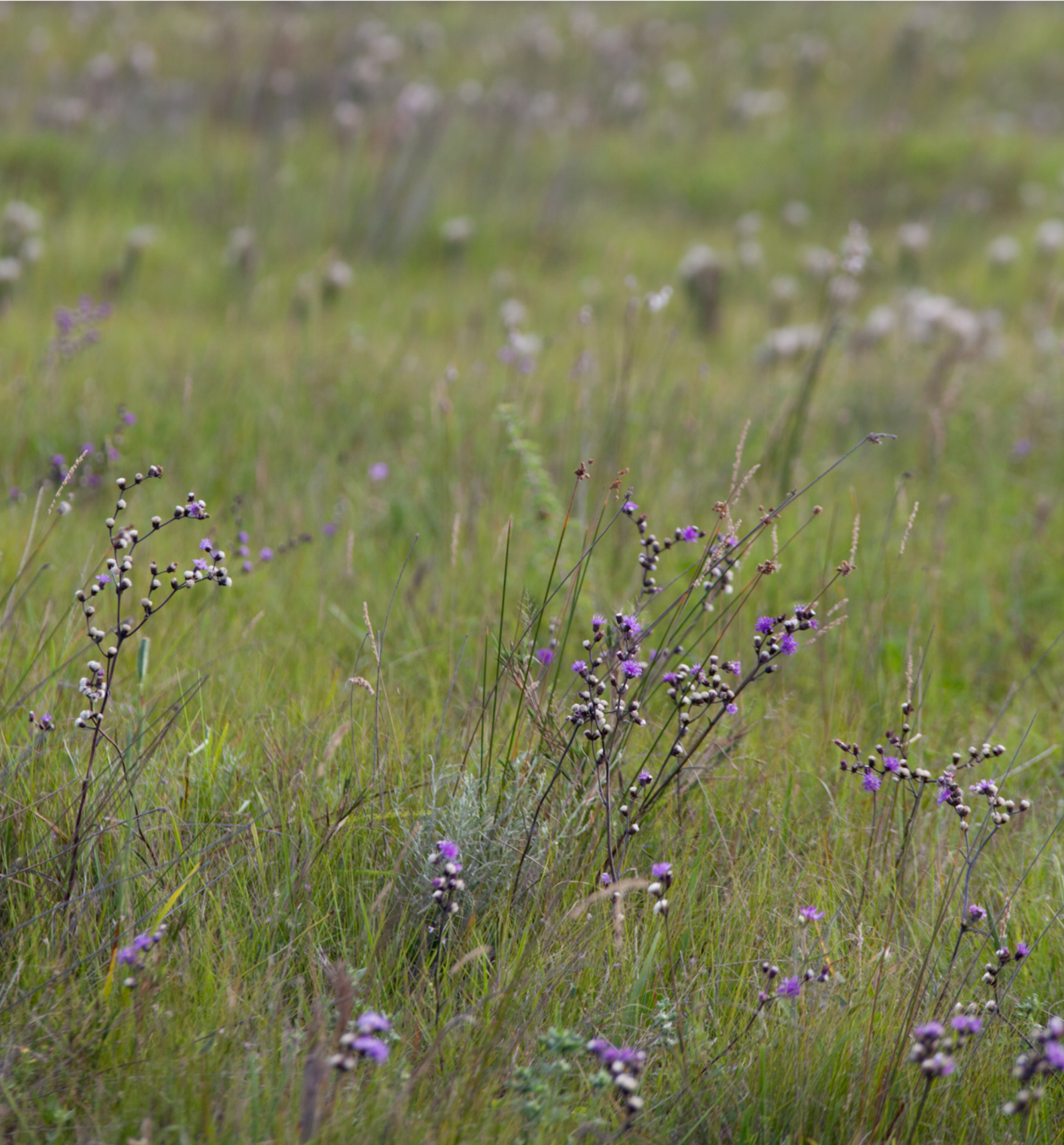
Parque Nacional Lagoa do Peixe

Mata Atlântica Biodiversidade e Mudanças Climáticas